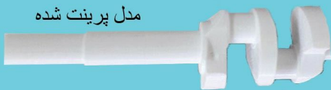
مدل پرینت شده